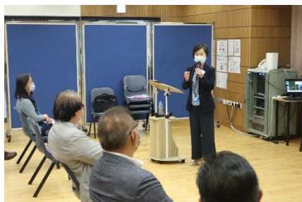
周年專題講座於 2021 年 5 月 29 日下午六時在聖公會聖十架小學舉行